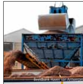
Beeldbank Haven van Antwerpen